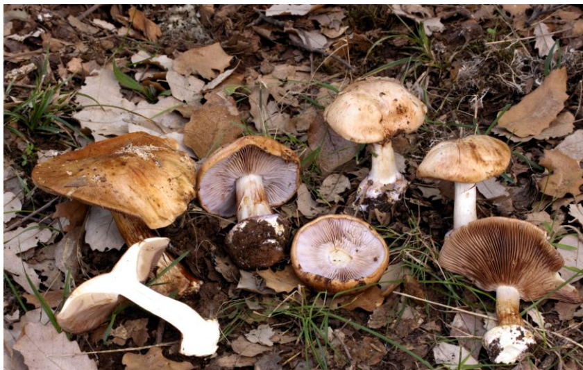
Fig. 2.1.- Cortinarius arcuatorum R. Hry.

≡ C. fulvoincarnatus (Joachim 1936) Bidaud, M-Loec & Reumaux 2001 Subgénero Phlegmacium (Fr.) Trog – Sección Calochroi M. M. Moser & E. Horak.