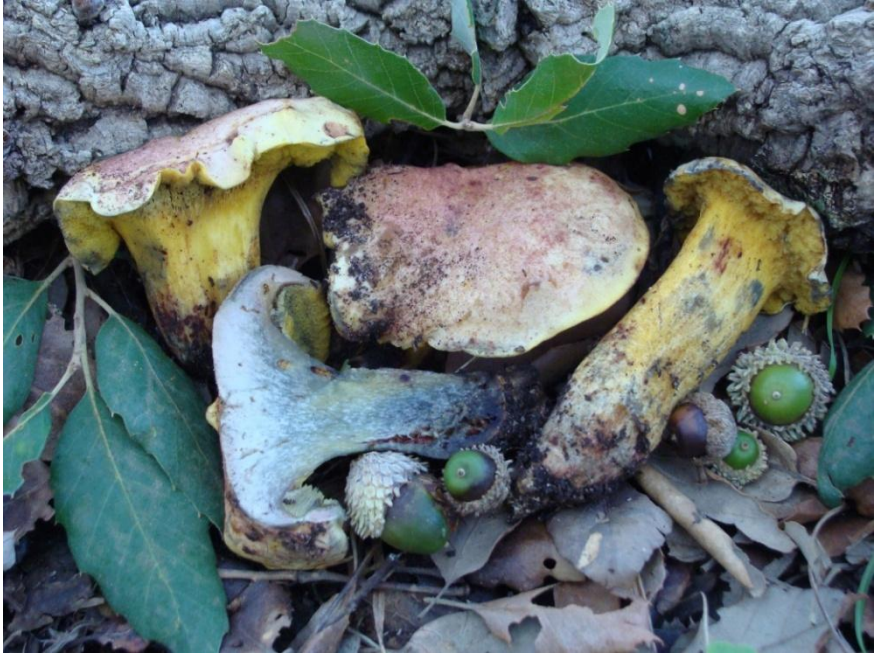
Fig.5.5. Pulchroboletus roseoalbidus (Alessio & Littini) Gelardi, Vizzini & Simonini

Huelva: Galaroza, Navahermosa, 29SQC0401 (ROMERO DE LA OSA, 2002); Talenque-La Suerte, 29SQC0400, JACUSSTA 97.