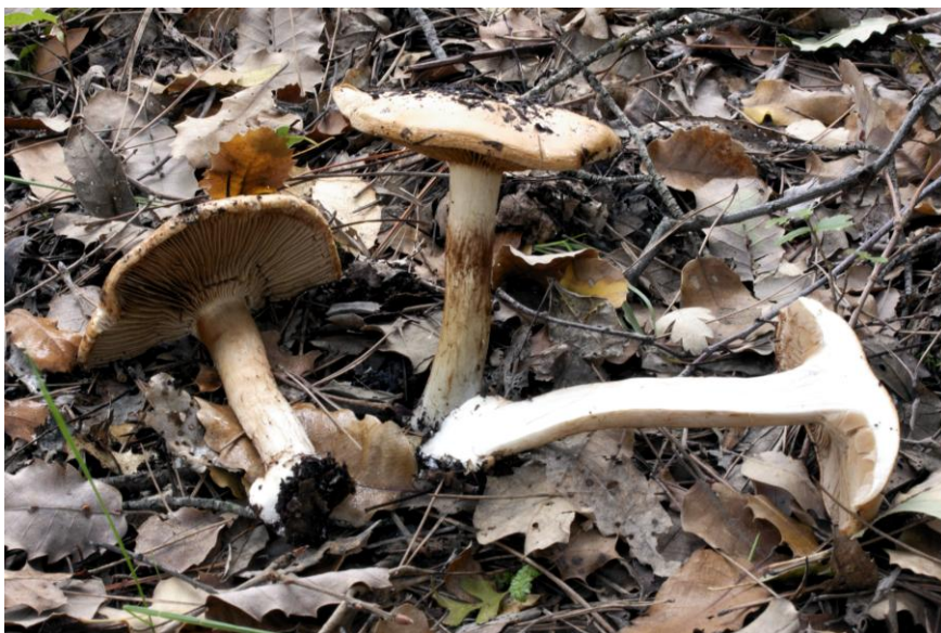
Fig. 2.2. Cortinarius rapaceoides Bidaud A., Riousset G. & L. Riousset

FUNGA NORDICA: Subgénero: Phlegmacium (Fr.) Trog – Sección Calochroi M. M. Moser & E. Horak