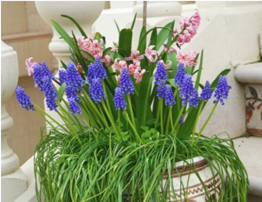
Fig.3.3.- Uso ornamental del muscari neglectum junto con jacintos ( hyacinthus ssp. )