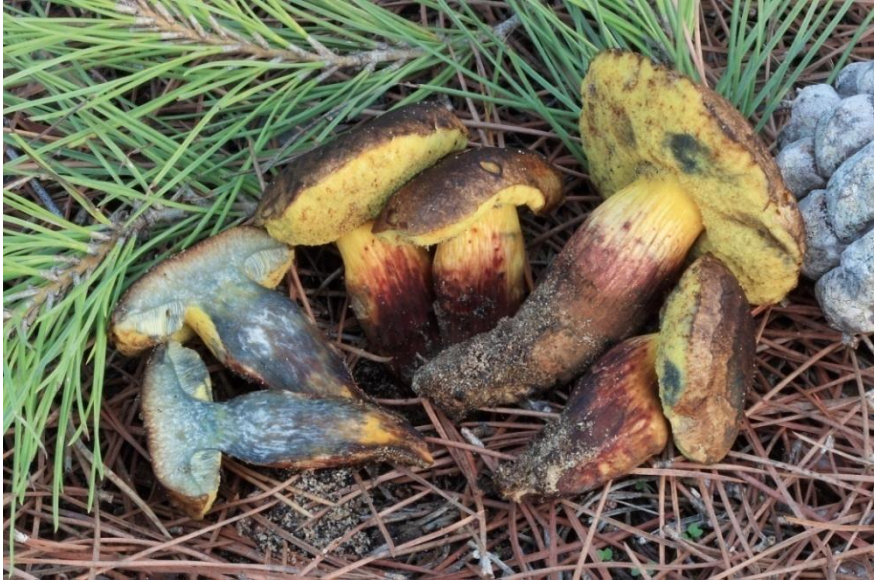
Fig.5.1. Alessioporus ichnusanus (Alessio, Galli & Littini) Gelardi, Vizzini & Simonini