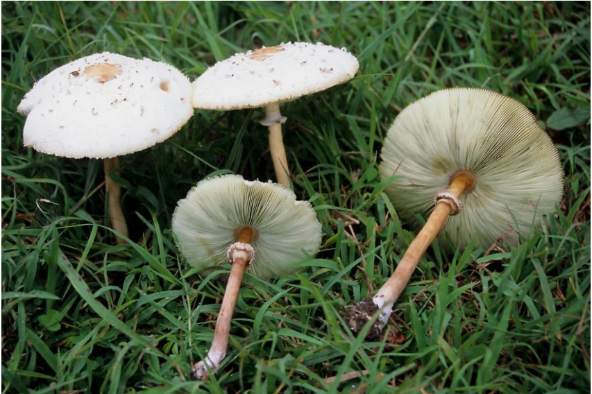
Fig. 7.1.- Chlorophyllum molybdites (G. Mey.) Masee, Chiang Mai (Tailandia).

≡ Macrolepiota molybdites (G. Mey.) G. Moreno, Bañares & Heykoop, Mycotaxon 55: 467 (1995)