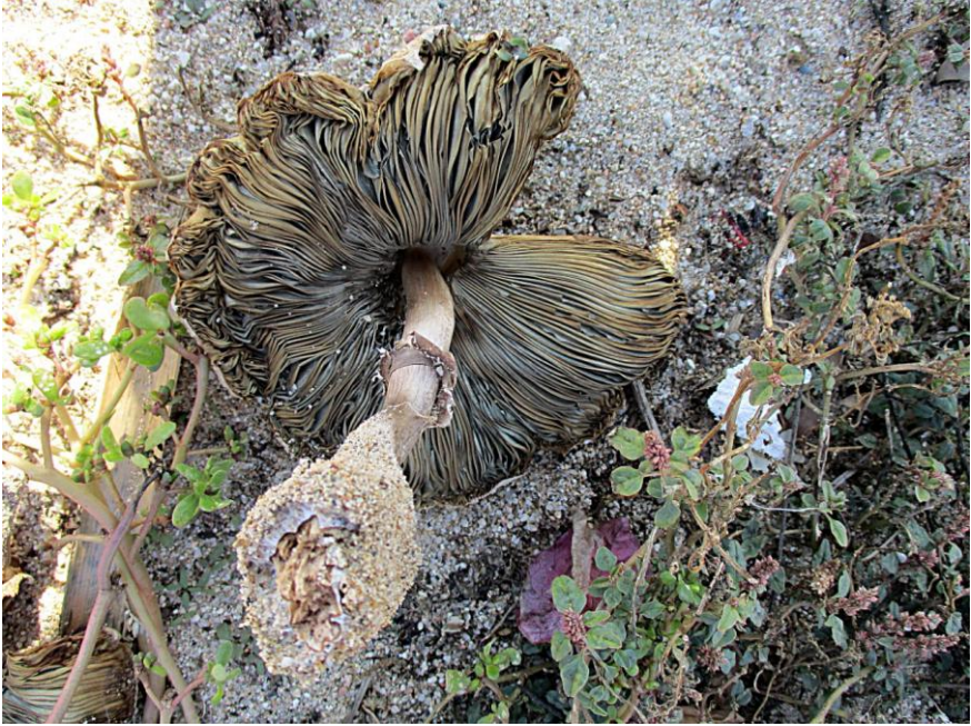
Fig. 7.3.- Chlorophyllum molybdites , detalle del himenio. Premià de Mar (Barcelona).