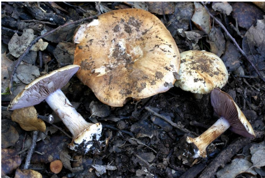
Fig. 2.3.- Cortinarius selandicus Frøslev & T. S. Jepessen