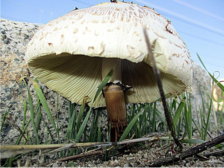
Fig. 7.2.- Chlorophyllum molybdites , aspecto general. Premià de Mar (Barcelona). Autor: A. González