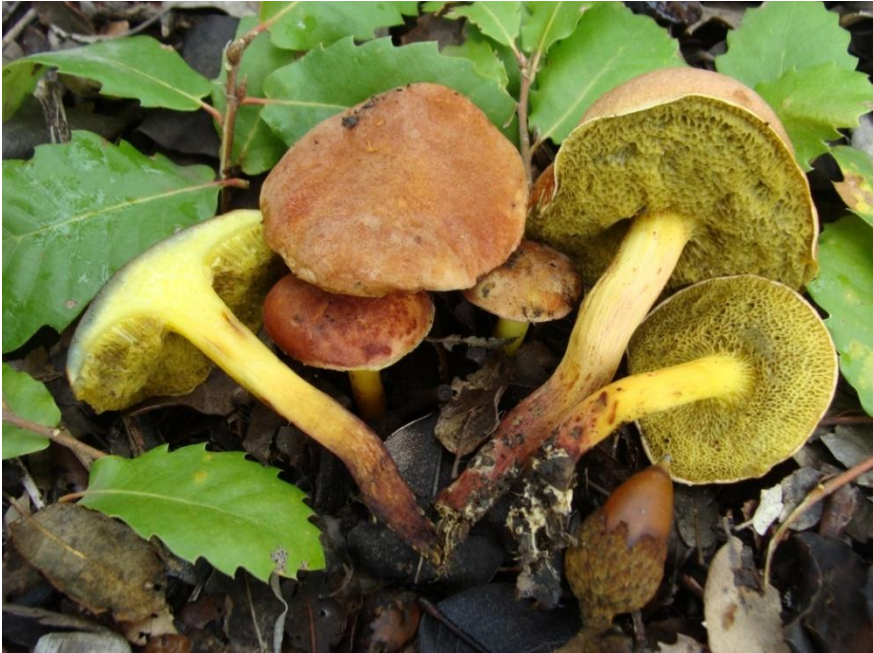
Fig.5.10. Xerocomellus redeuilhii A.F.S. Taylor, U. Uberh, Simonini, Gelardi & Vizzini.