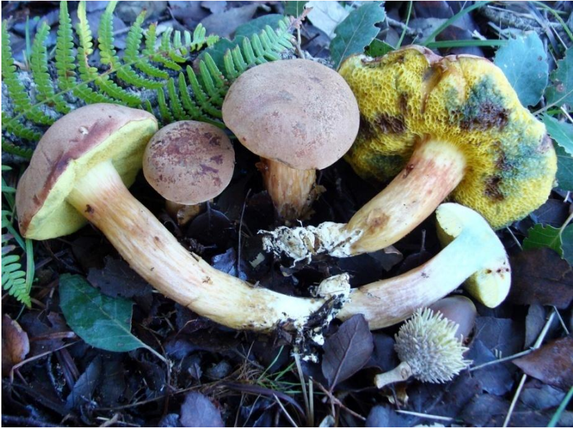
Fig.5.12. Xerocomus subtomentosus (L.: Fr.) Quél.