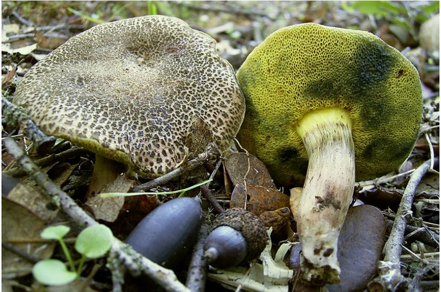
Fig.5.9. Xerocomellus porosporus (Imler ex Watling) Šutara.