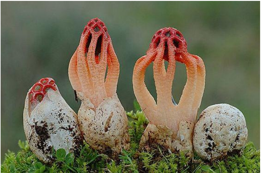
Fig.3.2.- Colus hirudinosus Cavalier & Sechier

Especie recogida en Las Viñas, Parque Natural de Andújar, Jaén, en zona de Pinus pinea , el 29 del 11 del 1997. VH1520. Herbario JA-F 158.