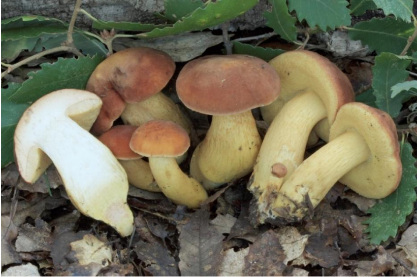
Fig.5.2- Aureoboletus moravicus (Vaček) Koflac