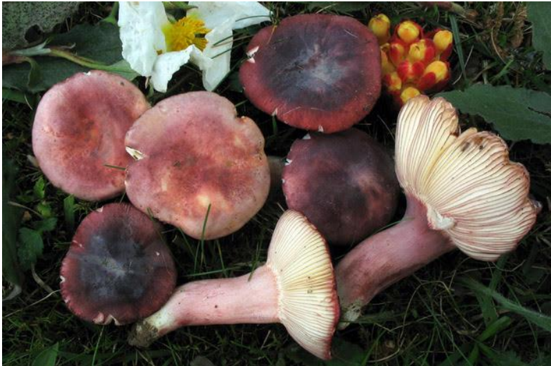
Fig.3.3.- Russula amoena Quélet