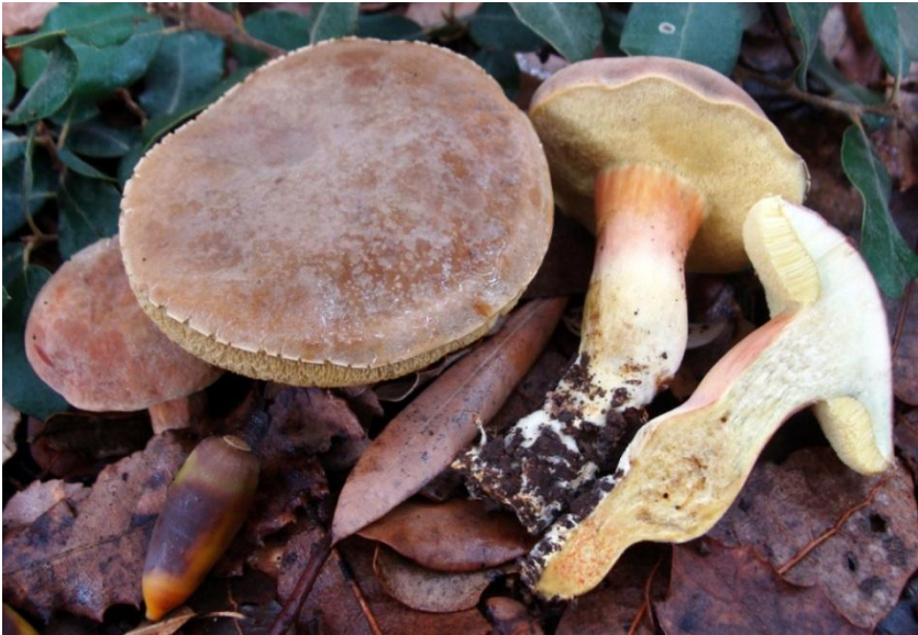
Fig.5.3. Hortiboletus engelii (Hlaváček) Biketova & Wasser

El género Hortiboletus se caracteriza por presentar pequeños puntos de color zanahoria o rojo-bermellón en la base en la carne de la base del estípite y a nivel microscópico por sus esporas lisas,