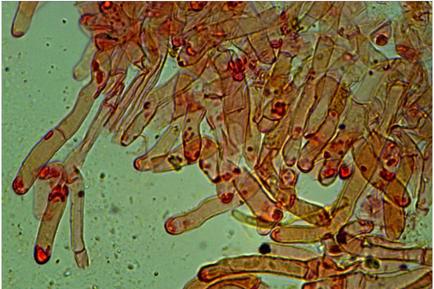
Fig.5.6.2. Hifas cutícula Rheubarbariboletus armeniacus (Quéél.) Vizzini, Simonini & Gelardi

2015). Taxón de apariencia macroscópica similar a la de Rheubarbariboletus persicolor (H. Engel, Klofac, H. Grünert & R. Grünert) Vizzini, Simonini & Gelardi, del que se diferencia por las incrustaciones que presentan las hifas de la pilleipellis