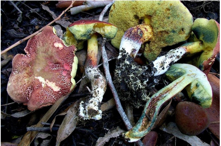
Fig.5.11. Xerocomellus ripariellus (Redeuilh) Šutara, Foto: T. Illescas.