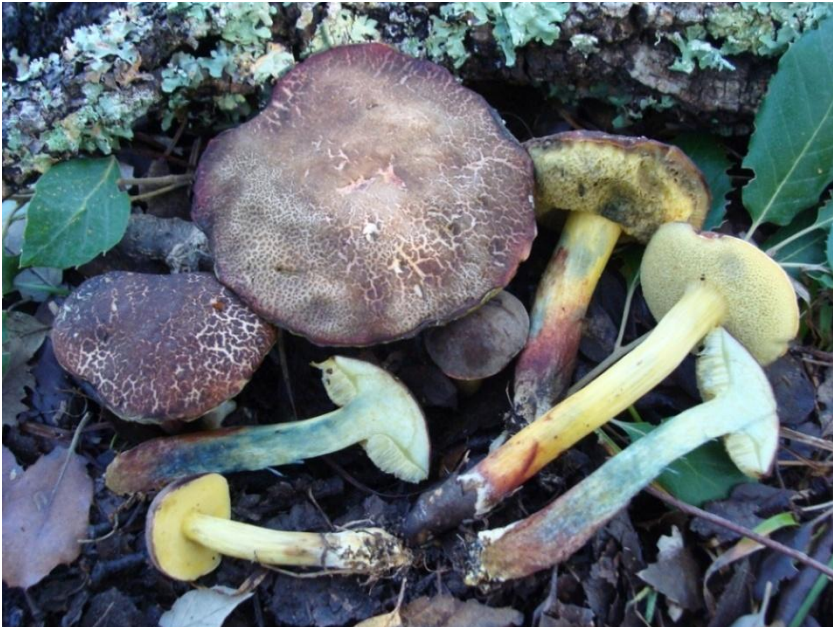
Fig.5.8. Xerocomellus cisalpinus (Simonini, H. Ladurner & Peintner) Klofac Observaciones personales

≡ Xerocomus cisalpinus Simonini, H. Ladurner & Peintner.