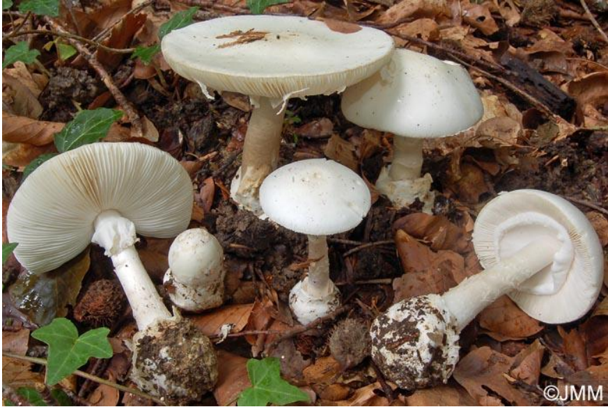
Fig.3.1.- Amanita phalloides var. alba Constantin & Dufour