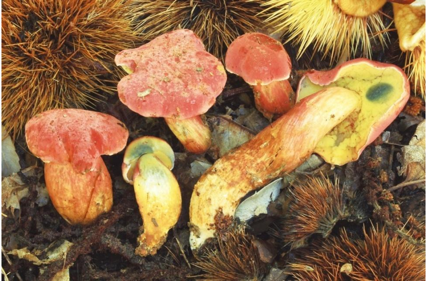
Fig.5.6.1. Rheubarbariboletus armeniacus (Quél.)