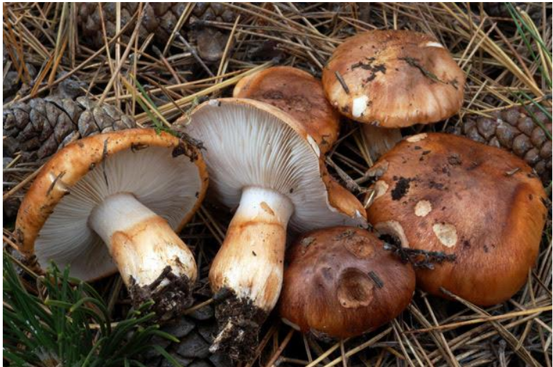
Fig.3.4.- Tricholoma batschii Gulden.