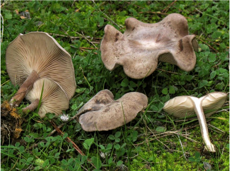
Fig. 6.1: Lyophyllum littoralis (Ballero & Contu) Contu

BON, M. (1993). Flore Mycologique D'Europe part. 5 , Lille.