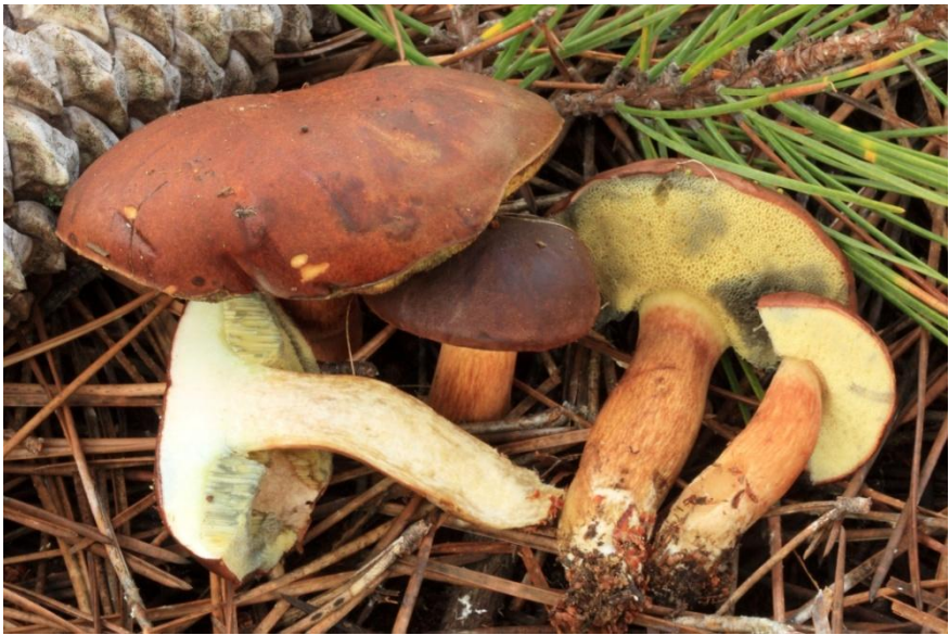
Fig.5.4. Imleriabadia (Fr.) Vizzini